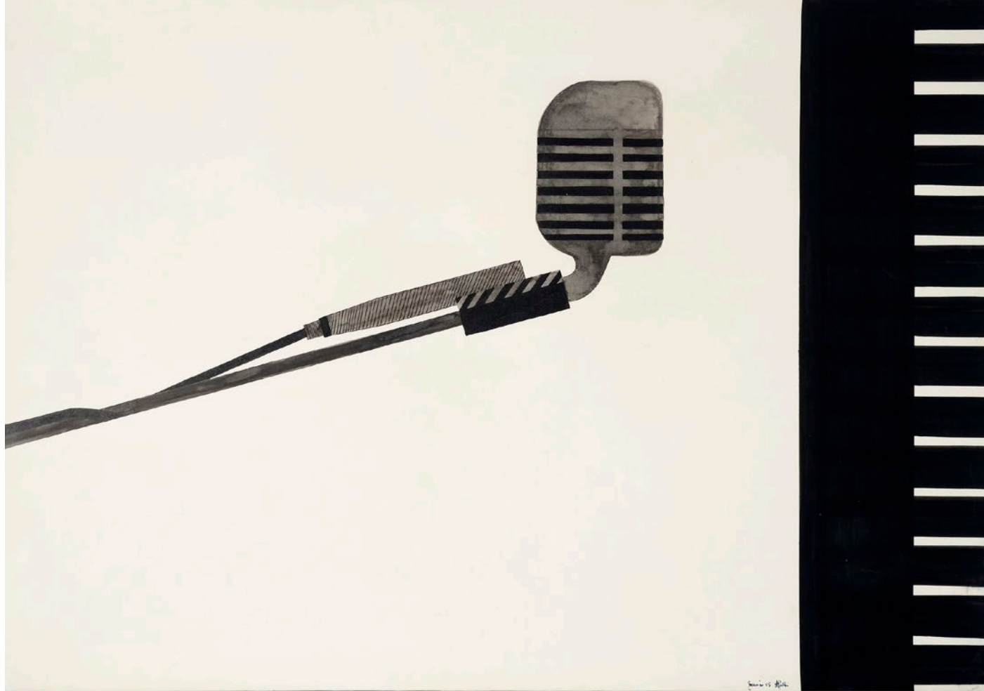
Alighiero Boetti, Untitled , 1965