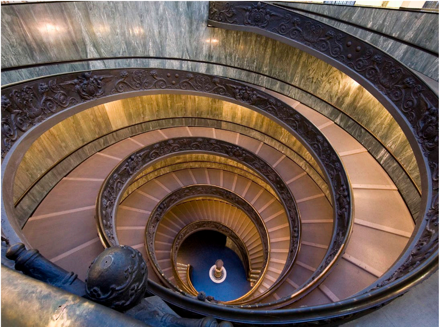
Scala elicoidale Musei Vaticani.

International quarterly of art and finance - Issue 1 - January 2021 - 3 euro