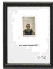
Paulo Bruscky «Pelos nossos desaparecidos», 1978

* Le buste di questa corrispondenza «clandestina» contenevano anche disegni, collage, litografie, poemi